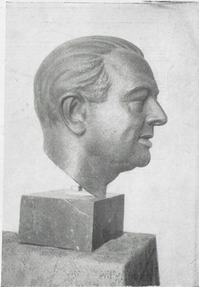
Busto del Maestro Guerrero, obra del escultor toledano CECILIO BEJAR.