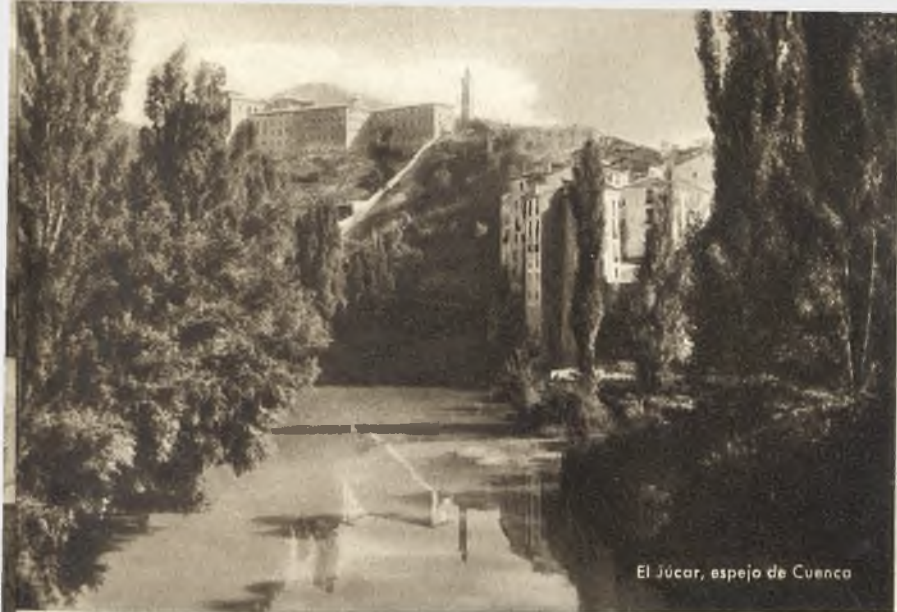
El Júcar, espejo de Cuenca

practicarse, incluso el esquí en la sierra de Tragacete, previo acondicionamiento de las pistas.