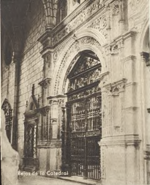
Rejas de la Catedral