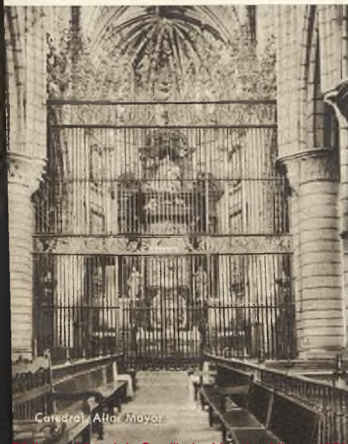
Catedral. Altar Mayor

SITUACION. — Cuenca tiene en la actualidad una población de 28.000 habitantes y es ciudad marcadamente pintoresca; está emplazada entre las cuencas que forman los ríos Júcar y Huécar, presentando una construcción urbanística sumamente original, dado que gran parte de sus calles y casas de toda la parte antigua están edificadas sobre rocas, como las mundialmente conocidas Casas Colgadas.