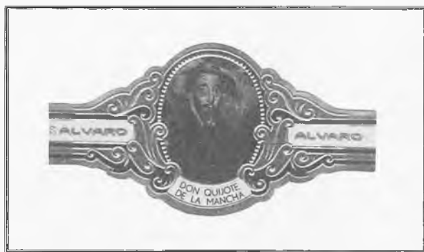
Vitola de Don Quijote de La Mancha de la Fábrica de Tabacos Álvaro, 1969. España