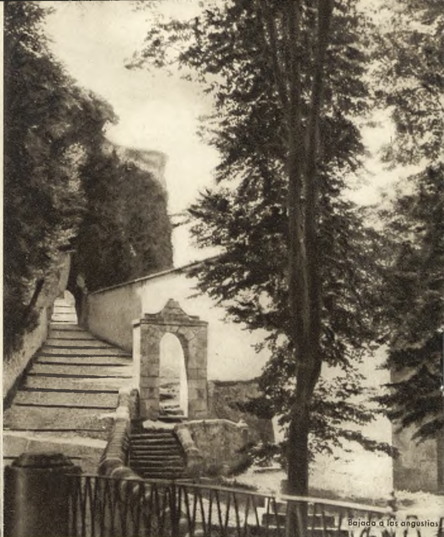
Bajada a las angustias

OFICINA DE INFORMACION DE LA DIRECCION GENERAL DEL TURISMO