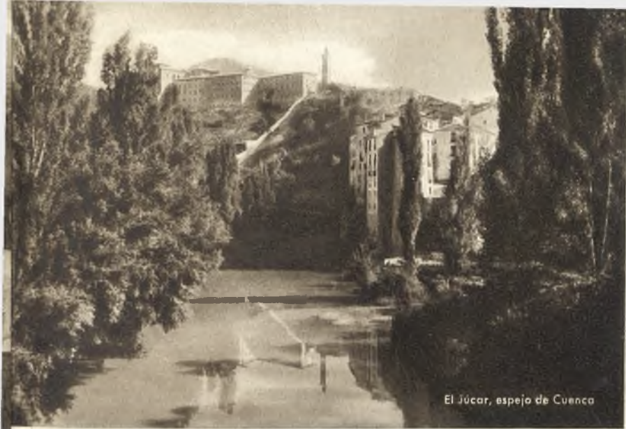
El Júcar, espejo de Cuenca

practicarse, incluso el esquí en la sierra de Tragacete, previo acondicionamiento de las pistas.