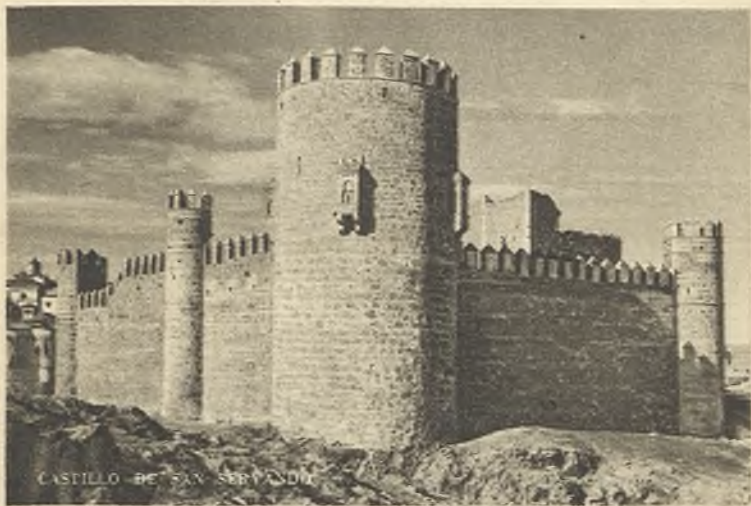
CASTILLO DE SAN SERVANDO