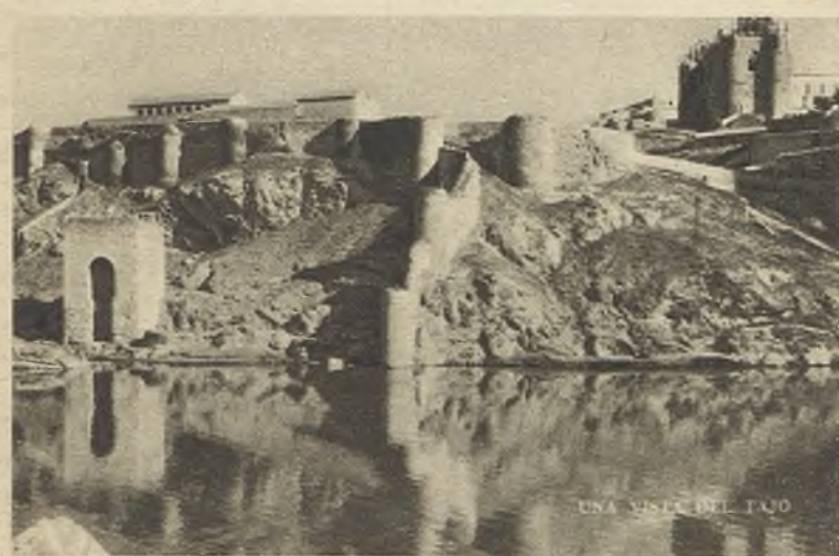
UNA VISTA DEL TAGO