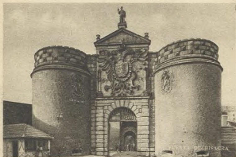
PUERTA DE BISAGRA