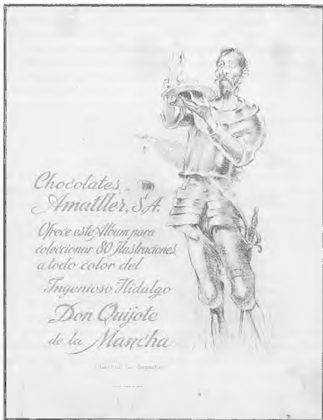
Portada Álbum de cromos de Don Quijote de La Mancha patrocinado por la firma Amatller, 1954. España