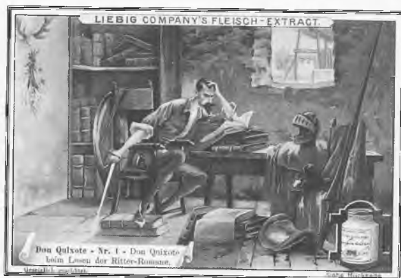
Cromo Liebig's Company, 1897-98. Alemania