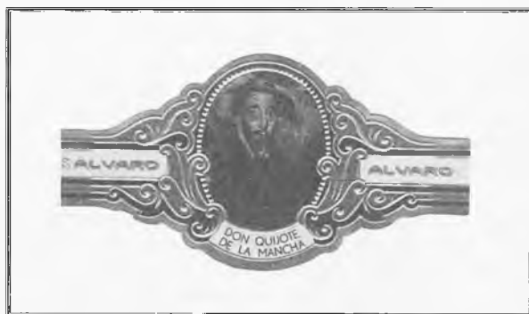
Vitola de Don Quijote de La Mancha de la Fábrica de Tabacos Álvaro, 1969. España