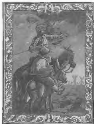
Cartel publicitario de latón de productos "Servus y Kaol". ¿1929? España